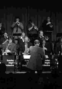
Sunday Night Orchestra

Bei schlechtem Wetter findet die Veranstaltung in St. Sebald statt.