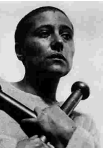
Maria Falconetti als Johanna

Bei schlechtem Wetter findet die Veranstaltung in St. Sebald statt.