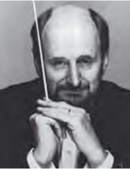
Sir Roger Norrington